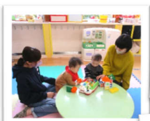
いっしょに あそぼう!