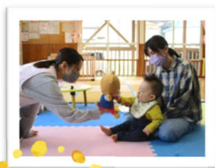
おたのしみ タイム