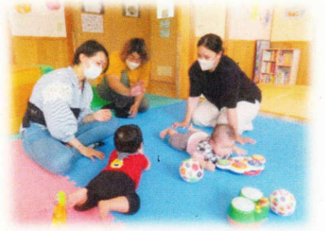
パパと一緒に嬉しいね♡