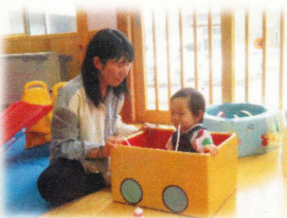
アンパンマン号でGO!

開室日: 月~金曜日 時間: 9時~14時 ♡ 赤ちゃん優先日: 木曜日♡ 未就園のお子さん1人につき 保護者2人までご利用できます。