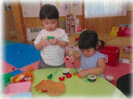
じっくりお料理中☆