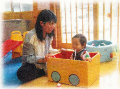
アンパンマン号でGO!

開室日: 月~金曜日 時間: 9時~14時 ♡赤ちゃん優先日: 木曜日♡ 未就園のお子さん1人につき 保護者2人までご利用できます。