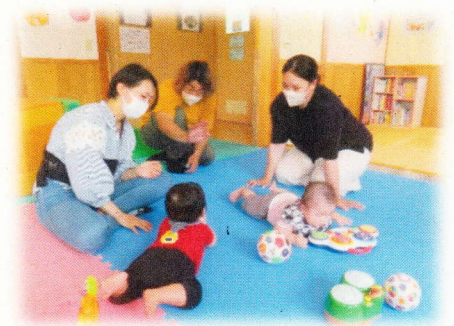
パパも一緒に嬉しいね♡